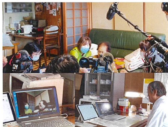
（図2）島内の東端（上新田）に在住の高齢者宅を、看護師がGSMで移動し、患者宅と診療所間でのオンライン診療のシーン。NHKを始めたくさんの取材がありました。

図2は、島内の遠隔地に在住の高齢者宅を看護師がGSMで移動し、栗島診療所からオンラインで訪問診療を行っているシーンです。