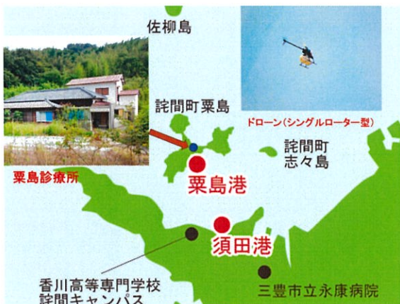
（図1）三豊市国民健康保険粟島診療所

粟島では、1960年代から約50年間にわたり個人の診療所が開設されていましたが、2012年より三豊市が診療業務を引き継ぎ、三豊市国民健康保険粟島診療所が開設されました。