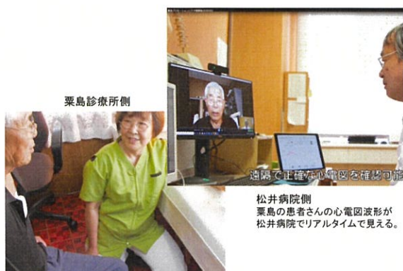
(図3) 体調が悪くなり(動悸の症状)診療所を受診した患者さんを、島外の医療機関(松井病院)から、リアルタイムで心電図波形を見ながらオンラインで診療しているシーン。

図3は、急に体調が悪くなり(動悸等)診療所を受診した患者さんを、島外の医療機関(松井病院)から、心電図波形を見ながらオンラインで診療しているシーンです。