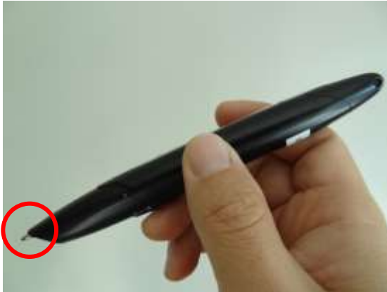
ペン先は、普通のボールペンがついている。