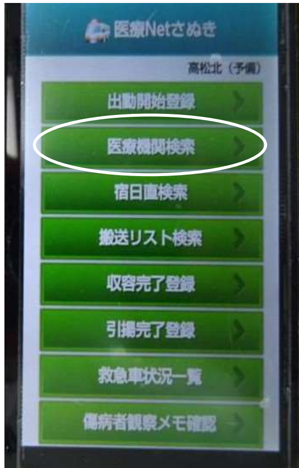
【スマートフォン初期画面】