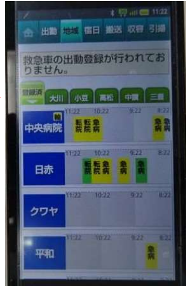
【医療機関検索画面】