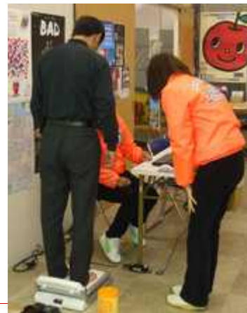
受付会場風景 (体組成測定)