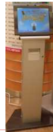
市内15カ所に設置した 歩数登録用端末