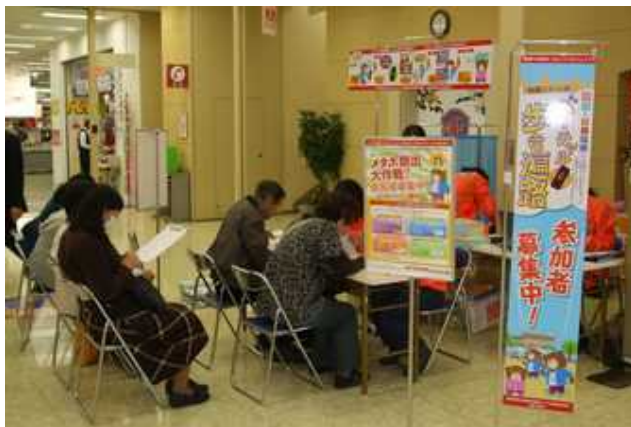
受付会場風景(申込・アンケート記入)